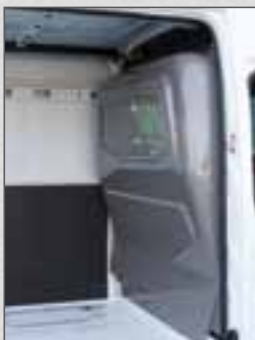
Trennwand hinter 1. Sitzreihe: extra tief für mehr Komfort

* Bei L2, L3 und L4 kann die Rückwand eventuell nach hinten gesetzt werden, wodurch extra Beinfreiheit entsteht.