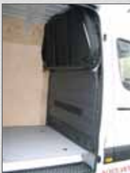
Produkt "Biwak". Klappbett in Transporterkastenwagen