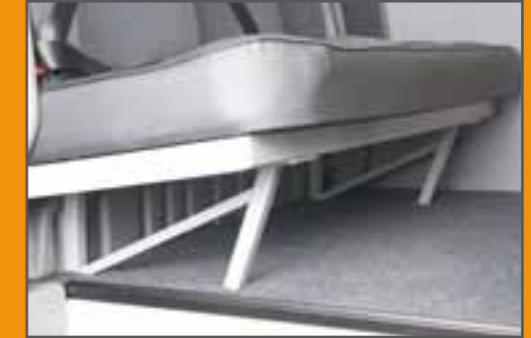
Basis, ohne Durchlademöglichkeit