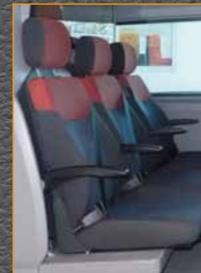
Option: Armlehnen für 3 Einzelsitze