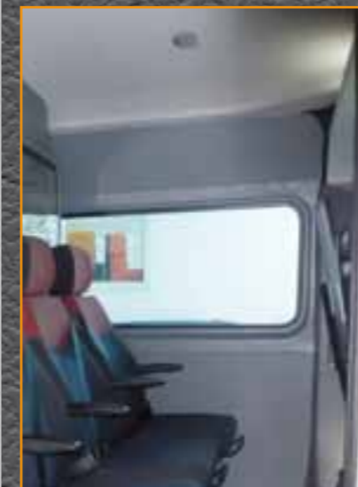
Wandverkleidung mit Fensterrahmen und vorgeformter Himmelverkleidung