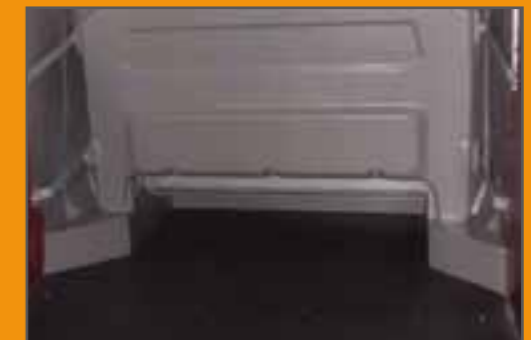
Rückansicht bei Durchlademöglichkeit