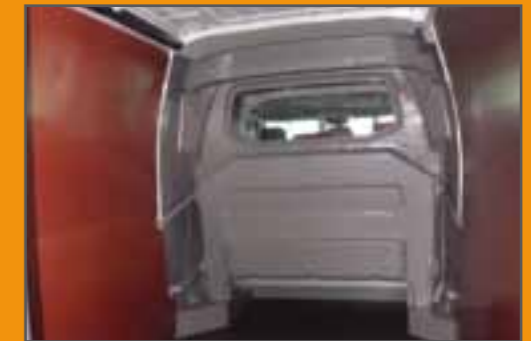
Rückansicht bei Durchlademöglichkeit