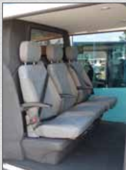
Verfügbar mit Sitzbank oder 3 separate Schiebesitzen